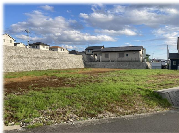
北西側より撮影現地土地 【掲載写真: 2024年5月撮影 ※街並み含む】